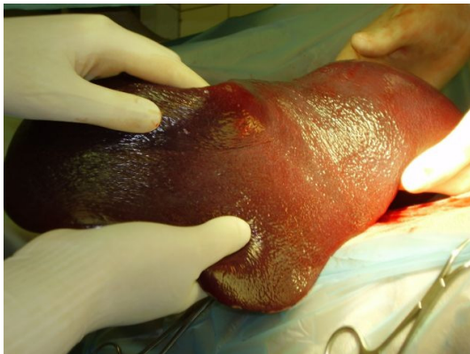
Heel sterk gezwollen en meegedraaide milt.

Direct contact opnemen met een dierenarts! De dierenarts zal de hond onderzoeken en eventueel röntgenfoto's maken, als er een maagtorsie vastgesteld wordt, moet er snel ingegrepen worden! Er wordt een infuus aangebracht en de hond wordt onder narcose gebracht. Eerst wordt dan geprobeerd met een slang door de slokdarm in de maag te komen, als dit lukt zal er al veel van het gas uit de maag ( en soms ook een beetje voedsel) komen. Daarna wordt via een operatie de maag terug gedraaid en vastgezet, zodat hij in de toekomst niet opnieuw kan gaan draaien. Als de milt mee gedraaid is, moet deze meestal worden verwijderd. De operatie is riskant, omdat de hond al heel ziek is als hij onder narcose gaat, maar veel keus is er niet, want als je niets doet gaat de hond hier zeker aan overlijden.