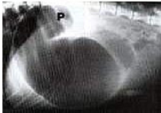
Röntgenfoto's van de met gas gevulde maag